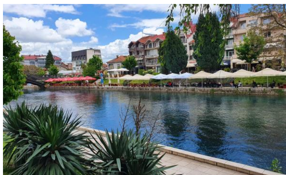
Strugë, pamje e shëtitores përgjatë Drinit të Zi