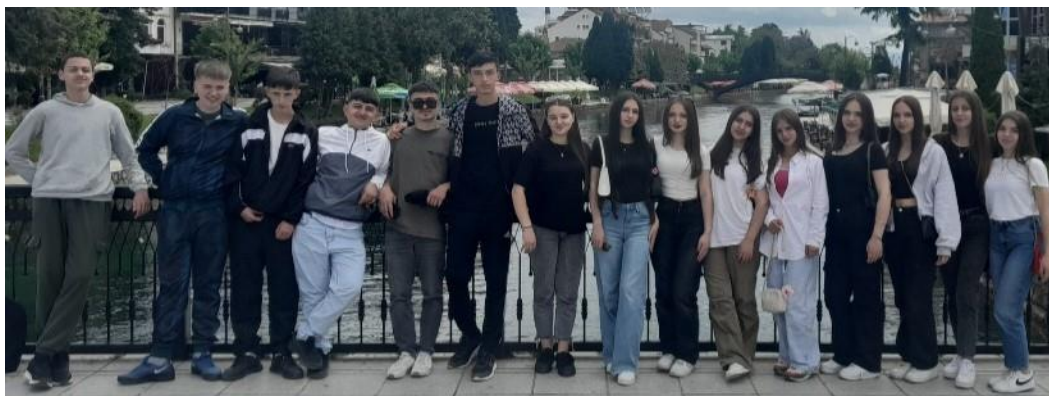
Nxënësit e kl.IX-1 fotografuar në një nga urat përgjatë lumit Drini i Zi në Strugë