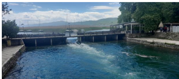
Strugë, Ura e parë prej druri mbi lumin Drini i Zi në dalje të liqenit të Ohrit

Më 22 maj 2025 u realizua ekskursioni njëditor me nxënësit e ciklit të lartë të SHF “Rilindja” të Sellcës dhe asaj periferike të Vicës në liqenin e Ohrit. Aktiviteti u organizua si pjesë e programit edukativ dhe kulturor të shkollës, me synimin për t’i njohur nxënësit nga afër me vlerat natyrore dhe trashëgiminë kulturore të rajonit të Strugës dhe Ohrit